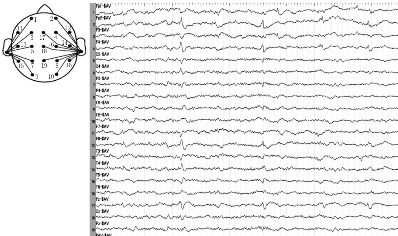
Fig. 3 Electroencephalography on admission.

Electroencephalography shows epileptic activities with frequent sharp waves in bilateral frontal regions.