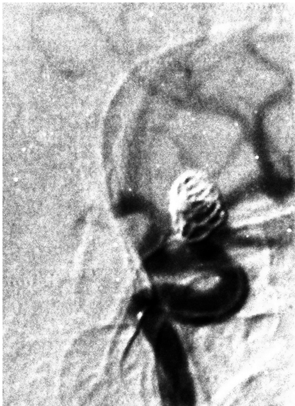
Ryc. 1. Angiografia cyfrowa tętnicy szyjnej wewnętrznej lewej. Niecałkowite wypełnienie tętniaka spiralą embolizacyjną

Przy przyjęciu chora była w stanie ogólnym dobrym, bez objawów ogniskowych ani deficytów neuropsychologicznych. Po przygotowaniu farmakologicznym (klopidogrel doustnie w dawce 75 mg raz na dobę przez 5 dni) przeprowadzono embolizację w znieczuleniu ogólnym, w godzinach rannych. Użyto cewnika prowadzącego Casasco 6F oraz mikrocewnika Casco 10+, przez który bez problemów technicznych umieszczono w obrębie tętniaka dodatkowe 4 spirale platynowe odczepiane mechanicznie. Stwierdzono, że zawój ostatniej z umieszczonych spiral uwypuklał się do światła naczynia. Po przeanalizowaniu sytuacji zdecydowano się na pozostawienie tej spirali pod osłoną heparyny drobnocząsteczkowej, ponieważ w kontrolnej angiografii nie stwierdzono zaburzeń przepływu krwi w kierunku gałęzi obwodowych tętnicy szyjnej, a po ewentualnym usunięciu