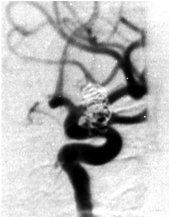
Ryc. 2. Stan bezpośrednio po embolizacji uzupełniającej tętniaka. Fragment spirali embolizacyjnej uwypukla się do światła tętnicy szyjnej wewnętrznej

Fig. 2. DSA after complementary embolization of the aneurysm. Last coil partially protrudes to the lumen of the internal carotid artery