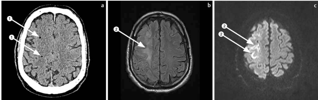
► Abb. 2 a CT-Schädel, transversale Schicht. b MRT-Schädel, transversale Sequenz: T2Flair-Wichtung. c MRT-Schädel, transversale Sequenz: DWI-b1000-Wichtung.

60-year-old man with left-sided hemiparesis after bronchoscopy