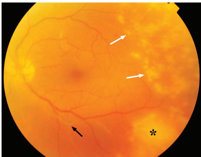
1. ábra Szemfenéki kép: (hátsó pólus) a temporális periférián több kisebb góciú (fehér nyilak), az alsó periférián részben konfluáló (csillag), körkörös terjedő, fehéres retinalis beszűrődések. Az alsó és felső artériás érágban (fekete nyíl) a véroszlop nem folytonos, a periféria felé fokozatosan elzártnak mutatkozik (obstrukció). A fotó kissé homályosabb megjelenése az üvegtesti sejtes kiszórásból adódik