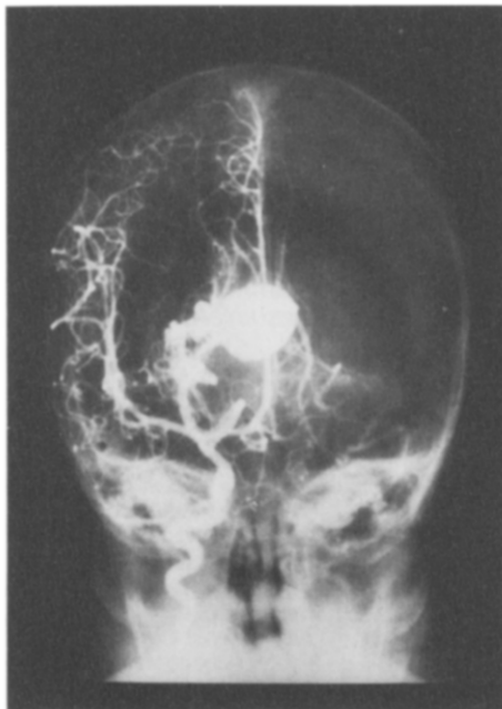
Fig. 2. — Artériographie carotidienne.

Quelques heures après son admission, l'enfant est dans un coma de stade II, avec paralysie faciale gauche et hémiparésie gauche qui contre-indiquent un geste chirurgical précoce. Un traitement symptomatique est effectué : ventilation artificielle, position proclive, restriction hydrique, barbituriques intraveineux. L'amélioration de l'état neurologique de l'enfant permet le sevrage du respirateur et l'extubation à j_4 .