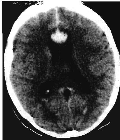
Abb. 1 Präoperatives cCT mit aufgeweiteten Seitenventrikeln, Blut im vorderen Interhemisphärenspalt, tamponierter und aufgeweiteter Cisterna pericallosa und stark reduzierter Gyruszeichnung.

Gegen 13.00 Uhr wird die Patientin in die nächste aufnahmebereite neurochirurgische Klinik verlegt, wo die zerebrale Angiographie das vermutete Aneurysma der A. pericallosa rechts bestätigt (Abb. 2). Das Aneurysma wird am gleichen Tag nach rechtsfrontaler Trepanation über einen interhemisphärischen Zugang geklippt, gefolgt von der Einlage einer extrakorporalen Ventrikeldrainage rechts frontal. Aufgrund verzögerter postoperativer Blutungsresorption und rezidivierender Infektionen (Lunge und ableitende Harnwege) ist eine